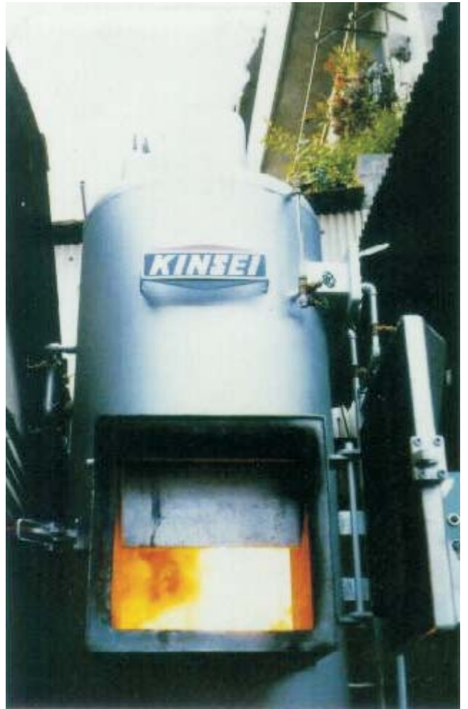
按裝地點與實際焚化情形