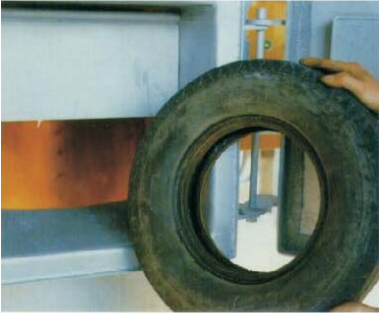
特殊設計投入時火焰不會溢出