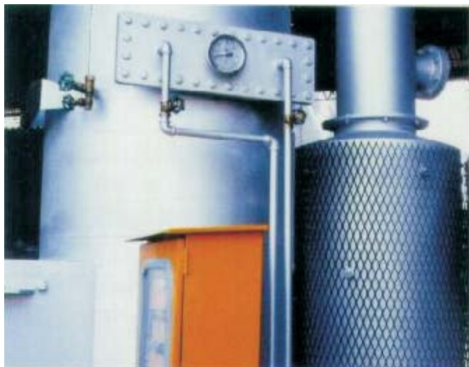
利用熱交換器，回收熱能的再次利用