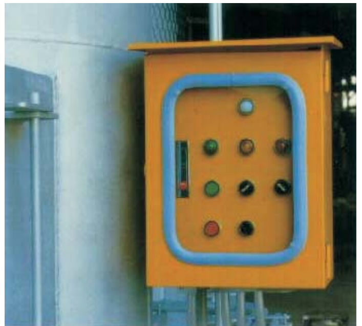
防水式的配電箱適合室外使用