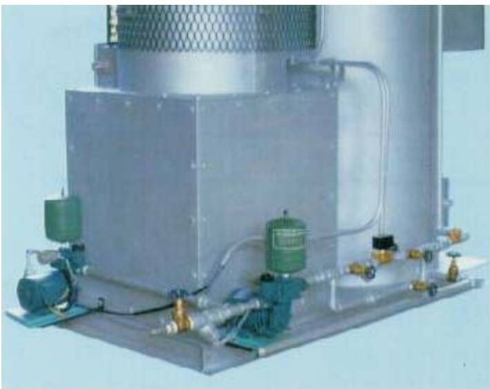
獨特的給水及熱水供應系統